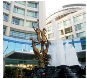
โรงพยาบาลกรุงเทพ